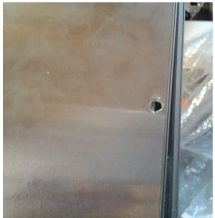
12. Een zeer slordig geboord gat, dat de lijst naar binnen dwingt en het daardoor onmogelijk maakt de centrale gaten te centreren.