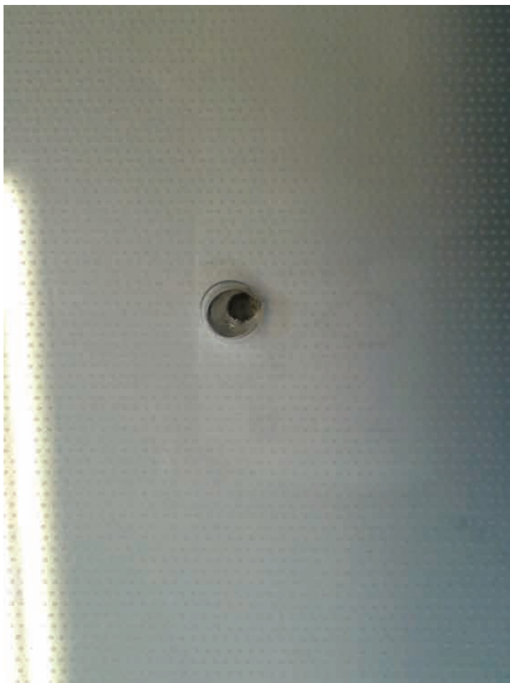
9. De 'centrale' gaten van de drie platen komen niet met elkaar overeen.