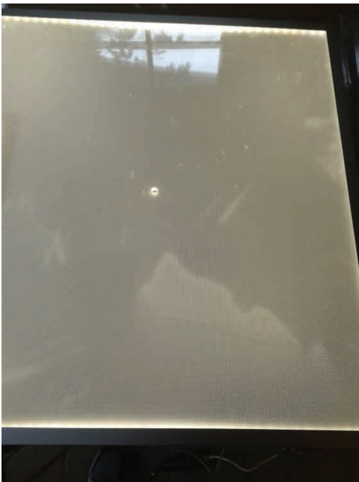
13. Vochtvlakken en handafdrukken zijn extra zichtbaar als het LED-paneel aan staat.