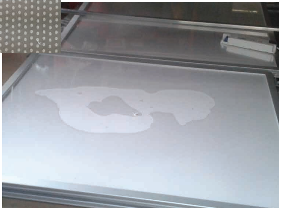
20. Een zeer grote vochtplek, waardoor de platen aan elkaar zijn vastgezogen.