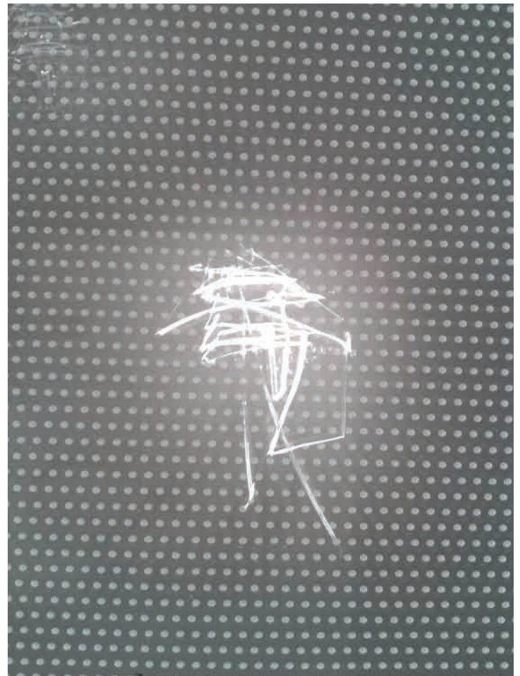
24. In de laatste twee gecontroleerde panelen zitten diepe krassen.