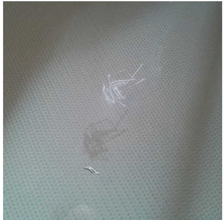
26. Het laatst gecontroleerde paneel heeft dezelfde krassen als de voorgaande. Die krasplekken op deze panelen (als 9e & 10e gecontroleerd) lijken in spiegelbeeld ten opzichte van elkaar. Hier ook weer aluminium krulletjes gevonden, zoals op de foto zichtbaar is.