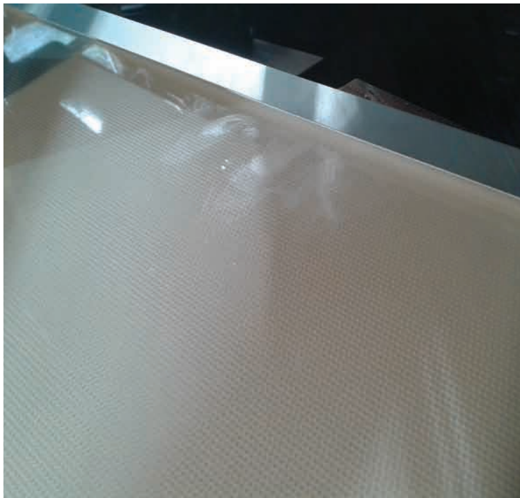
25. Meer vlekken...